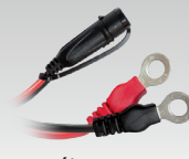
Pólus saru 45 cm - M6 029194