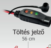
Töltés jelző 56 cm