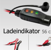
Ladeindikator 56 cm 029149