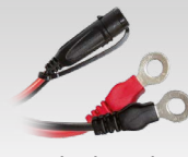
Eyelet-kontakt 45 cm - M6 029194