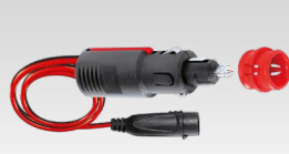
Zestaw do gniazda zapalniczki 35 cm - 029439