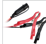
Alicates (45 cm)