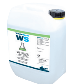
ref. 062511 Posebno hladilno sredstvo za varjenje - 5 l