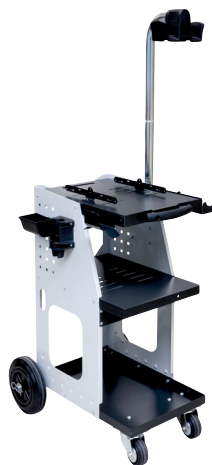
ref. 051331 + 052284 UNIVERSAL 800 + potence