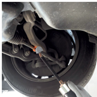
Sprostitev krmiljenja palice