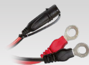
Öljettkontakt 45 cm - M6 029194