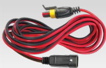
Förlängningsladd 2,5 m - 029057